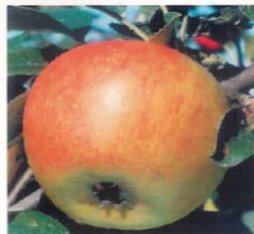
Reinette de Blenheim