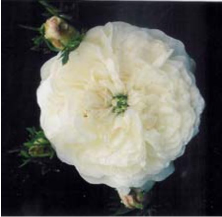
Mme Hardy, rosier de Damas