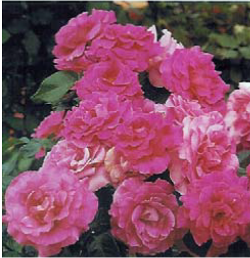
« Manou Meiland » rosier Floribunda