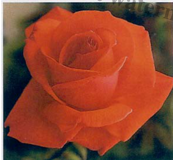
« Super Star » hybride de Th©