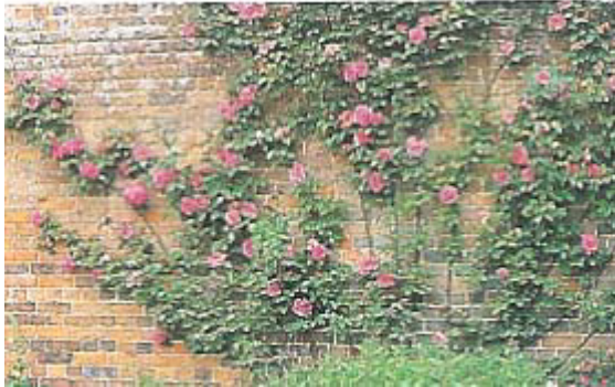
Rosier Bourbon conduit en espalier