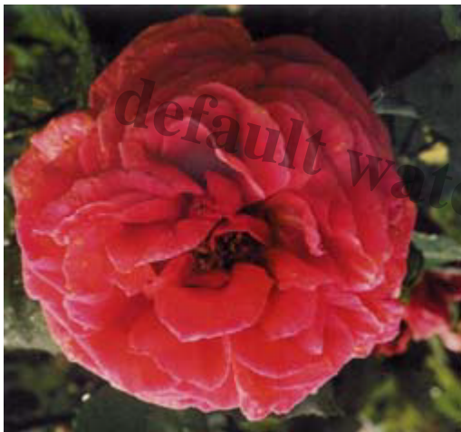
« Isaac Pereire », rosier Bourbon