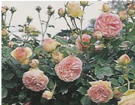
• Pierre de Ronsard rosier moderne obtenteur Meilland (1986) croisement « Kalinka » x « Haendel » et « Danse des Sylphes »

C'est une activité florale reconnue et les variétés nouvelles ne peuvent être multipliées qu'avec l'accord des obtenteurs (Delbard, Meilland, Laperrière, etc.).