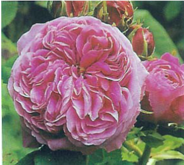
Rosier de Portland Â« Yolande d'Aragon Â», obtenteur Vibert (1843)