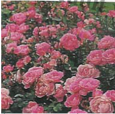
« Sylvie Vartan » rosier Floribunda