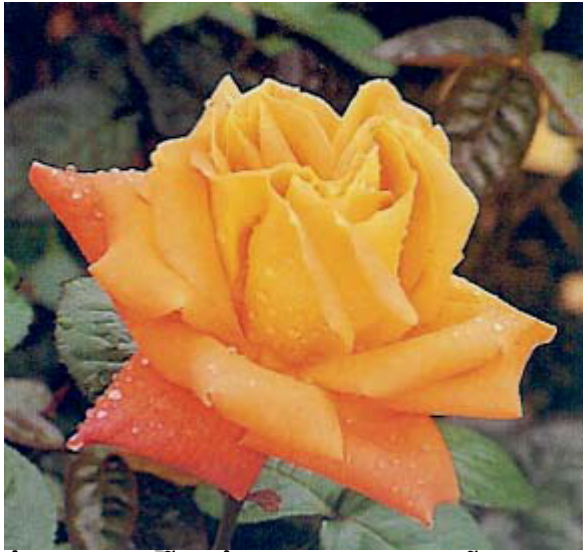
« De Fun's » hybride de Th©