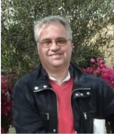
Christian Otoul Rue bois grand-père 15 5030 Gembloux