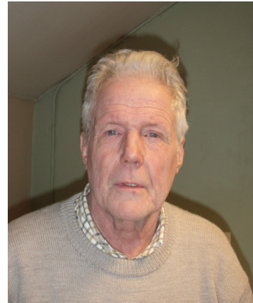
Guy Dethy Rue Try Colau 10A 5030 Lonzée